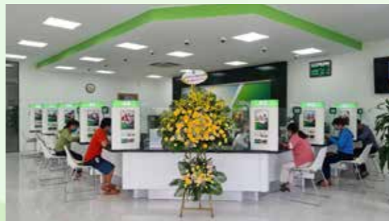
Không gian giao dịch tiêu chuẩn, tạo cảm giác thoải mái cho khách hàng.

Phòng Giao dịch Sóc Sơn tọa lạc tại khu đô thị mới dân cư đông đúc, gần chợ, trung tâm thương mại, có nhiều cơ sở kinh doanh và giao thông thuận tiện, được thiết kế theo chuẩn nhận diện thương hiệu Vietcombank, với cơ sở vật chất khang trang, hiện đại, diện tích rộng rãi, thông thoáng, cùng đội ngũ cán bộ, nhân viên chuyên nghiệp, giỏi chuyên môn nghiệp vụ, chu đáo tận tâm, cung cấp đầy đủ các dịch vụ ngân hàng phù hợp với mọi đối tượng khách hàng, hứa hẹn sẽ mang đến nhiều trải nghiệm dịch vụ tốt nhất cho khách hàng.