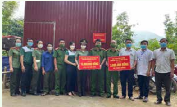
Bàn giao lán chốt kiểm soát dịch bệnh tại thôn Nậm Bết, xã Tân Tiến, huyện Bảo Yên, tỉnh Lào Cai.

Ngày 31/8/2021, Vietcombank Lào Cai phối hợp với Phòng Tổ chức Cán bộ, Công an tỉnh Lào Cai đã tổ chức bàn giao lán chốt kiểm soát dịch COVID-19 tại 2 chốt kiểm soát của huyện Bảo Yên, tỉnh Lào Cai, địa bàn tiếp giáp với tỉnh Hà Giang.