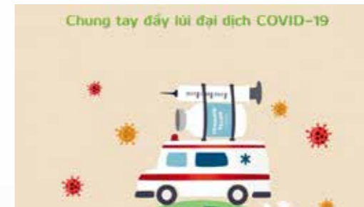
Hình ảnh minh họa

Năm nay, do dịch COVID-19 diễn ra rất phức tạp, Ban Chấp hành Đoàn Thanh niên Vietcombank Nghệ An đã quyết định không tổ chức Lễ tuyên dương học sinh có thành tích tiêu biểu - là con của các cán bộ, đảng viên và người lao động hiện đang công tác và làm việc tại Chi nhánh - như thường lệ, tuy nhiên, vẫn tặng quà cho các em đạt thành tích xuất sắc năm học 2020 - 2021.