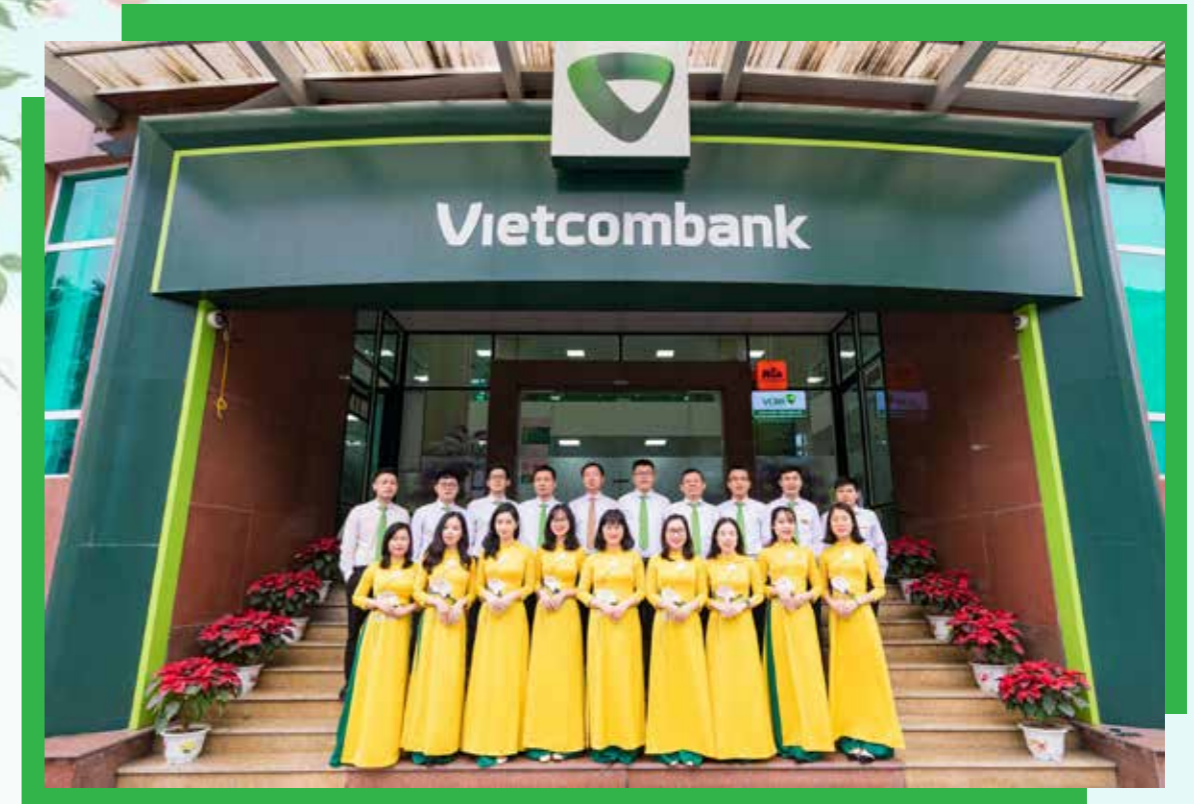
Đoàn viên thanh niên Vietcombank Quảng Ninh.

Những thành tựu của Vietcombank Quảng Ninh trong suốt chặng đường 30 năm qua đã được lãnh đạo các cấp ghi nhận với những phần thưởng cao quý như: Huân chương Lao động hạng Nhì, Huân chương Lao động hạng Ba của Chủ tịch nước, Cờ thi đua của Chính phủ, Bằng khen của Thủ tướng Chính phủ, Cờ thi đua của Ngân hàng Nhà nước, Bằng khen của Thống đốc Ngân hàng Nhà nước, Bằng khen của Chủ tịch UBND tỉnh Quảng Ninh, Giấy khen của Chủ tịch HĐQT Vietcombank và