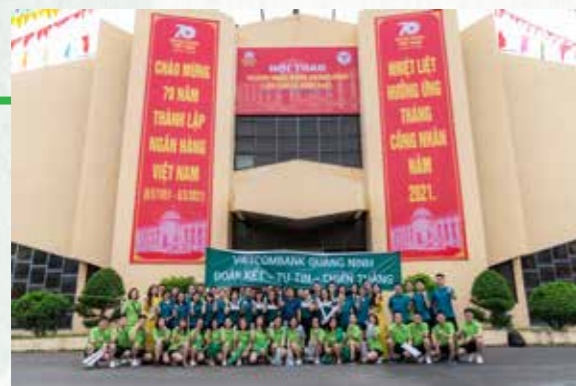
Vietcombank Quảng Ninh tham gia Hội thao Ngành Ngân hàng Quảng Ninh lần thứ IX năm 2021.

Là ngân hàng có bề dày truyền thống, Vietcombank Quảng Ninh đang ngày một khẳng định vai trò là một trong những chi nhánh lớn trong hệ thống Vietcombank và trên địa bàn, quản trị tốt, hoạt động hiệu quả, chất lượng nguồn nhân lực cao và có trách nhiệm với cộng đồng xã hội. CĐCS Vietcombank Quảng Ninh luôn dành sự quan tâm đặc biệt cùng tâm huyết và những đóng góp thiết thực cho công tác an sinh xã hội (ASXH). Từ năm 2010 đến nay, bằng sự đóng góp của tập thể CBNV, NLĐ, Vietcombank Quảng Ninh đã dành gần 20 tỷ đồng cho các chương trình ASXH tập trung cho các lĩnh vực y tế, giáo dục, tặng quà cho người nghèo, gia đình chính sách, thương bệnh binh, phụng dưỡng Mẹ Việt Nam Anh hùng; ủng hộ