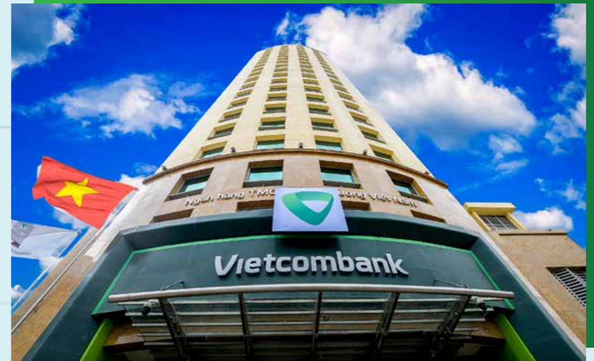
Trụ sở chính Vietcombank, 198 Trần Quang Khải, Hoàn Kiếm, Hà Nội

S&P đã có những nhận xét tích cực về Vietcombank như: ngân hàng có thị phần lớn, thương hiệu uy tín và tiếp tục tin tưởng rằng Vietcombank sẽ kiểm soát tốt ảnh hưởng của dịch COVID-19 tới chất lượng tài sản và lợi nhuận. S&P sẽ nâng định hạng của Vietcombank nếu S&P nâng định hạng tín nhiệm quốc gia của Việt Nam trong vòng 12-24 tháng tới.