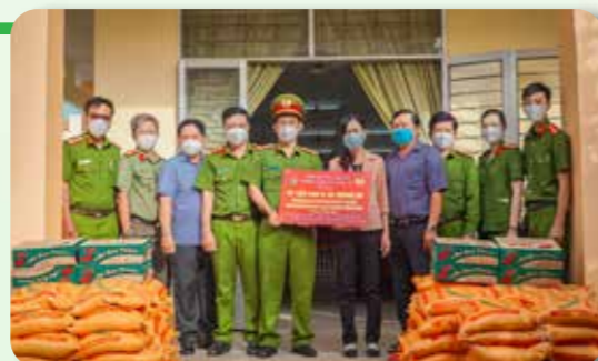
Đại diện Phòng Cảnh sát Kinh tế, Công an tỉnh Long An trao quà tại UBND xã Tân Trạch, huyện Cần Đước, tỉnh Long An.

Vừa qua, Phòng Cảnh sát Kinh tế, Công an tỉnh Long An đã phối hợp cùng Vietcombank Long An, Công ty TNHH Lavie và Công ty TNHH MTV SXKT Long An hỗ trợ Người dân có hoàn cảnh khó khăn và lực lượng tuyến đầu chống dịch COVID-19 tại xã Tân Trạch, huyện Cần Đước; Công an TP. Tân An và “Bếp ăn nghĩa tình” của Tỉnh Đoàn Long An, mỗi đơn vị 1 tấn gạo và 50 thùng mì.