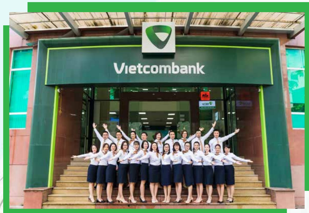
Tập thể cán bộ quản lý và cán bộ lãnh đạo phòng Vietcombank Quảng Ninh.