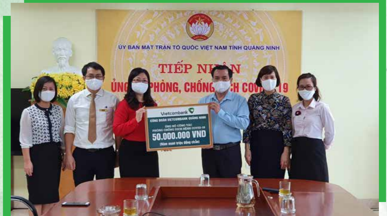
Vietcombank Quảng Ninh trao 50 triệu đồng ủng hộ công tác phòng chống dịch COVID-19 tại tỉnh Quảng Ninh năm 2020.

Công đoàn Vietcombank Quảng Ninh với tôi hội tụ đầy đủ sự trẻ trung, năng động, nhiệt huyết, nhân ái và sẻ chia. Đó không chỉ là nơi cán bộ nhân viên gửi gắm tâm tư, tình cảm, nguyện vọng của mình mà còn là nhịp cầu kết nối tình đồng nghiệp, tình bạn bè, anh em. Trong sự thành công của Vietcombank Quảng Ninh hôm nay có sự đóng góp rất lớn của biết bao thế hệ cán bộ nhân viên đã và đang miệt mài cống hiến vì một Vietcombank vững vàng vươn ra biển lớn.