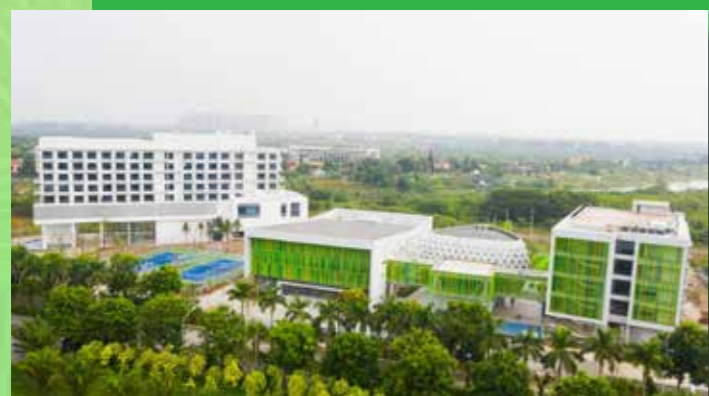
Toàn cảnh Trường Đào tạo Vietcombank tại Ecopark.

Với những nỗ lực không ngừng nghỉ, sau hơn 2 năm thành lập, công tác đào tạo đã đạt được những kết quả ấn tượng: Số lượt đào tạo liên tục tăng qua các năm (năm 2020 đạt 67.988 lượt, tăng 147% so với năm 2019 và tăng hơn 200% so với năm 2018). Số lượt đào tạo bình quân năm 2020 đạt 3,55 lượt/cán bộ (gấp 1,45 lần so với năm 2019 và gấp 1,66 lần so với năm 2018). 100% cán bộ tân tuyển có thử việc (theo đăng ký của các đơn vị) được đào tạo cấp chứng chỉ hành nghề. Số lượng cán bộ tham gia đào tạo theo bản đồ đào tạo cũng đạt kết quả khả quan (dự kiến đến cuối năm 2021, hơn 90% cán bộ sẽ hoàn thành lộ trình đào tạo 0-12 tháng) dù đây là lần đầu tiên được triển khai tại Vietcombank và việc triển khai còn chịu nhiều ảnh hưởng của dịch bệnh.