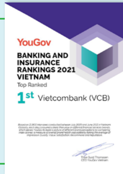
Vietcombank - thương hiệu số 1 trong Bảng xếp hạng các thương hiệu Ngân hàng và Bảo hiểm hàng đầu Việt Nam 2021.