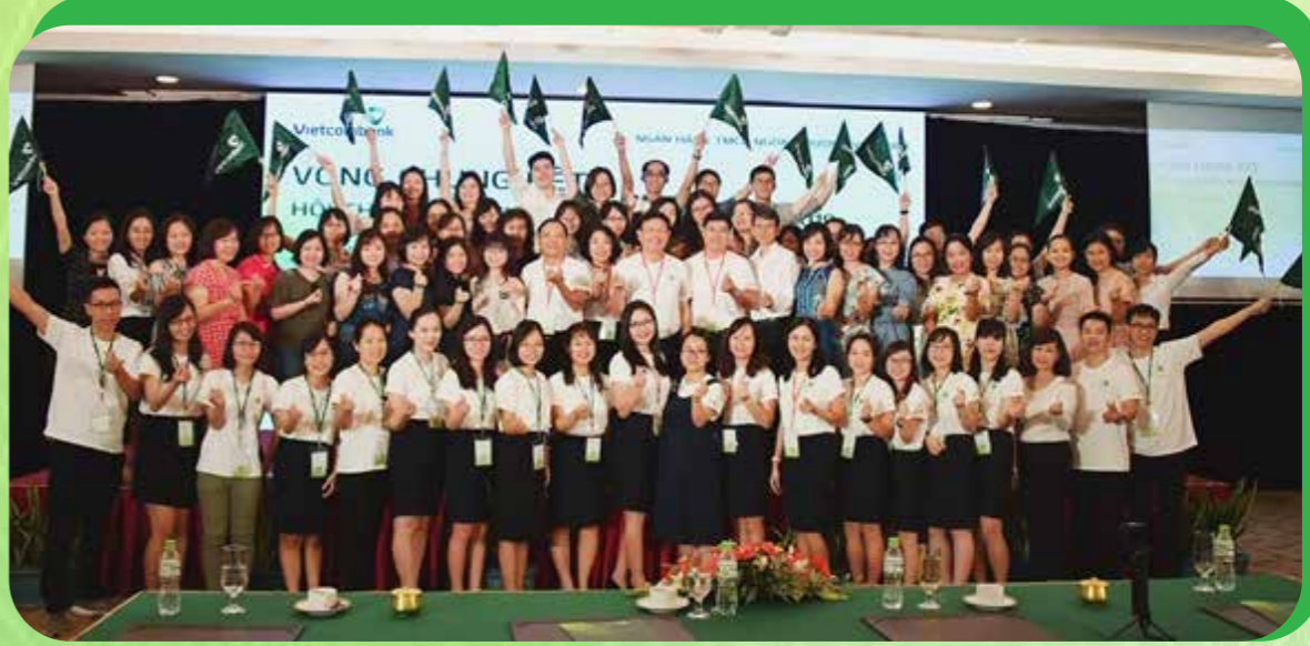
Hội thi nghiệp vụ tài trợ thương mại của Vietcombank năm 2019.

Có thể nói, hoạt động NCKH của Vietcombank đã phát triển vượt bậc và từng bước đi vào thực chất. Điều này thể hiện ở tính đa dạng, tính thiết thực, tính chuẩn mực của các hoạt động NCKH, đảm bảo chất lượng các kết quả nghiên cứu, gia tăng sự gắn kết giữa nghiên cứu và hoạt động kinh doanh của Ngân hàng.