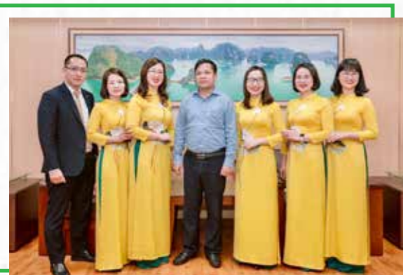
Ban Giám đốc và đại diện Ban Chấp hành Công đoàn cơ sở Vietcombank Quảng Ninh

khi vừa đảm nhận vị trí Trưởng phòng Khách hàng doanh nghiệp vừa là một “tài năng trẻ” của tỉnh Quảng Ninh với những đóng góp cho công tác Đoàn và phong trào thanh niên; một nữ Trưởng phòng Khách hàng bán lẻ và bốn nữ Trưởng phòng giao dịch tận tụy, miệt mài với công tác phát triển bán lẻ theo định hướng của Vietcombank; một nữ Trưởng phòng Hành chính nhân sự luôn ngày đêm trăn trở, chăm lo cho cán bộ nhân viên chi nhánh cùng biết bao công tác hành chính quản trị, xây dựng cơ bản, tin học; và thêm nữa, Trưởng phòng Kế toán, Trưởng phòng Quản lý nợ, Trưởng phòng Ngân quỹ của chúng tôi đều là nữ... Có thể nói, từ các vị trí lãnh đạo chủ chốt trong công tác khách