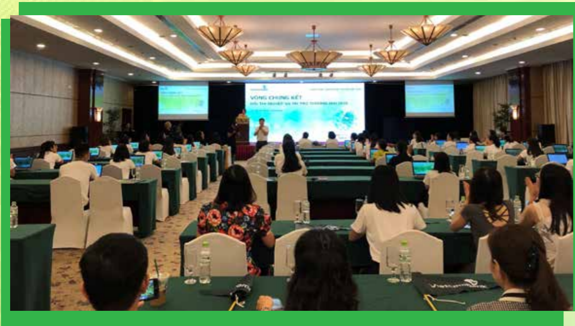
Hội thi nghiệp vụ tài trợ thương mại của Vietcombank năm 2019.

PV: Thưa ông, hoạt động quản lý và NCKH ở Vietcombank trong những năm gần đây đã có những thay đổi gì? Chuyển đổi số đang tác động sâu rộng đến mọi hoạt động và mọi lĩnh vực, Vietcombank ứng dụng chuyển đổi số vào hoạt động quản lý và NCKH như thế nào?