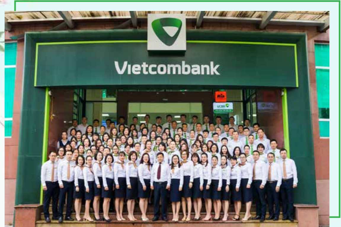
Tập thể CBNV Vietcombank Quảng Ninh.

Quảng Ninh, hoạt động thanh toán quốc tế (TTQT) của Vietcombank Quảng Ninh đáp ứng hầu hết các giao dịch thanh toán xuất nhập khẩu (XNK) trên địa bàn tỉnh. Với ưu thế về đối ngoại, giai đoạn từ năm 1991 – năm 2001, hoạt động TTQT của Chi nhánh tăng trưởng nhanh, tổng giá trị thanh toán XNK năm 2001 đạt 84 triệu USD, tăng gấp 140 lần so với năm 1991. Năm 2011, Quảng Ninh là tỉnh đầu tiên thành lập Ban xúc tiến và hỗ trợ đầu tư (PAPI) trong cả nước với vai trò xây dựng cơ chế chính sách thu hút đầu tư, cải thiện môi trường đầu tư, nâng cao năng lực cạnh tranh cấp tỉnh, hỗ trợ doanh nghiệp, quảng bá xúc tiến đầu tư, hỗ trợ thị trường. Nhận thấy đây là