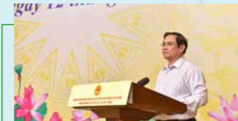
Thủ tướng Chính phủ Phạm Minh Chính phát biểu tại Lễ phát động chương trình “Sóng và máy tính cho em”.

Với mục tiêu xuyên suốt là hướng tới một ngân hàng xanh, phát triển bền vững vì cộng đồng, trong những năm qua, hoạt động an sinh xã hội của Vietcombank không ngừng được đẩy mạnh với nhiều chương trình thiết thực, ý nghĩa, được triển khai trên quy mô lớn, đóng góp vào sự phát triển chung của cộng đồng, xã hội, trong đó tập trung vào hai lĩnh vực trọng điểm là giáo dục và y tế. Với việc đầu tư cho các chương trình cộng đồng trong lĩnh vực giáo dục, Vietcombank đã khẳng định cam kết đồng hành cùng thế hệ trẻ của đất nước, hỗ trợ các em phát huy tài năng và trí tuệ của mình; đồng thời khẳng định sự quan tâm đến sự nghiệp