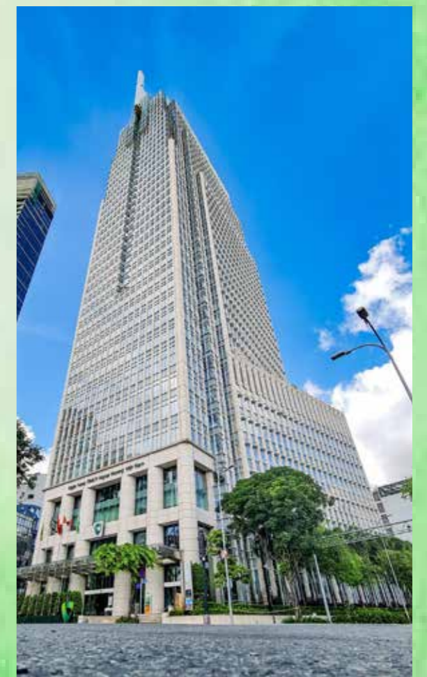
Trụ sở chi nhánh ngày nay.