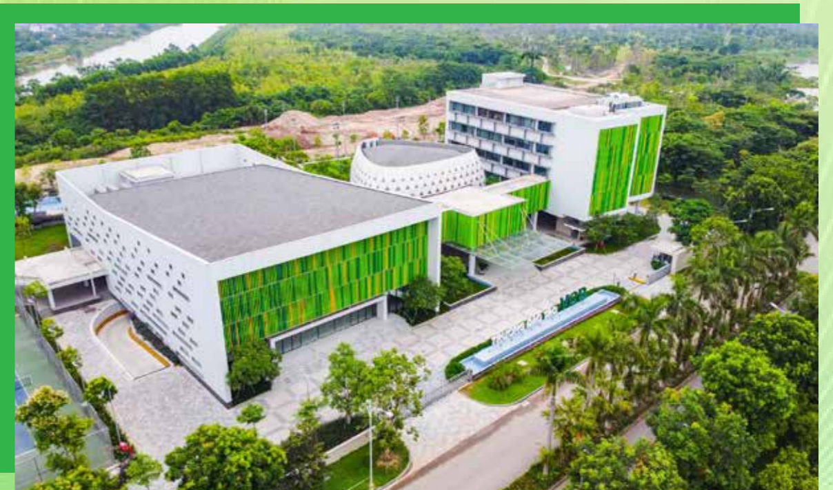
Toàn cảnh Trường Đào tạo Vietcombank tại Ecopark.

Với đội ngũ cán bộ, Trường thiết kế/tổ chức các chương trình riêng biệt cho 2 nhóm đối tượng: Nhóm cán bộ thuộc khối CNTT và nhóm cán bộ ngoài khối CNTT. Theo đó, những cán bộ làm công việc liên quan trực tiếp đến CNTT và là nòng cốt trong công tác chuyển đổi số, ngoài việc tham gia các khóa đào tạo trong khuôn khổ các dự án của Vietcombank, các chương trình nhằm phát triển kỹ năng, nâng cao nhận thức về xu hướng, văn hóa chuyển đổi số sẽ được tham gia các nội dung mang tính chất chuyên sâu (như AI, Big Data, Agile...). Với nhóm cán bộ ngoài khối CNTT, Trường tập trung vào việc đào tạo sản phẩm/quy trình/chính sách... có ứng dụng hoặc là thành quả của chuyển đổi số cũng như đào tạo kỹ năng làm việc trong thời đại mới.