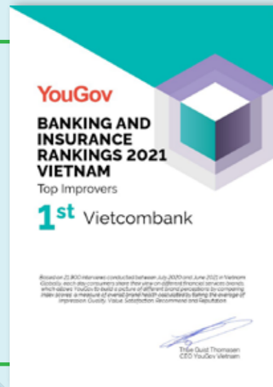
Vietcombank – thương hiệu số 1 trong Top các thương hiệu Ngân hàng và Bảo hiểm có sự cải thiện hàng đầu.