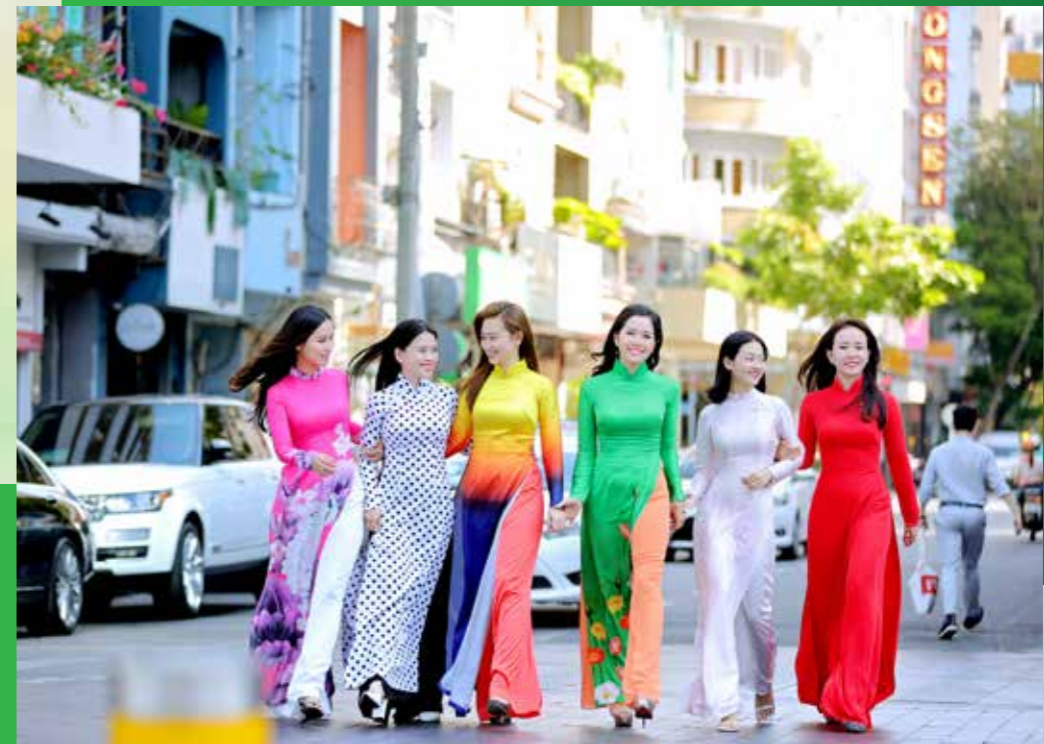
Thế hệ trẻ Vietcombank TP. Hồ Chí Minh hôm nay

“ Xa em trót đã bao năm Nhưng lòng vẫn mãi sáng trong tình người! Chúc em trẻ - khỏe - đẹp tươi Cộng đồng gắn kết, không từ gian nan Đi đầu hội nhập về vang Chung niềm tin với vững bền ngày mai! Quan tâm không sót một ai Vượt qua Covid- ta nào tiến lên Dặm trường - thương hiệu xứng tên Vietcombank Thành phố lập nên sử vàng! 45 năm qua cơ nghiệp về vang 45 năm tới huy hoàng đẹp hơn! Nghĩa tình - đồng nghiệp keo sơn Cộng đồng gắn kết xây đời nở hoa Ôi! Vietcombank của chúng ta...”