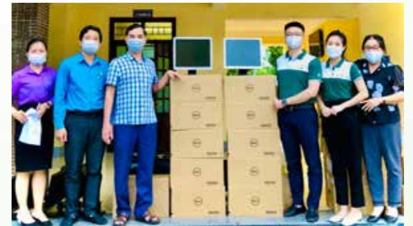
Đại diện Vietcombank Nghệ An trao tặng máy tính cho đại diện Sở GD-ĐT Nghệ An

Ngày 17/9/2021, Vietcombank Chi nhánh Nghệ An đã tham gia Lễ phát động Chương trình “Sóng và máy tính cho em” do Sở GD - ĐT Nghệ An tổ chức.